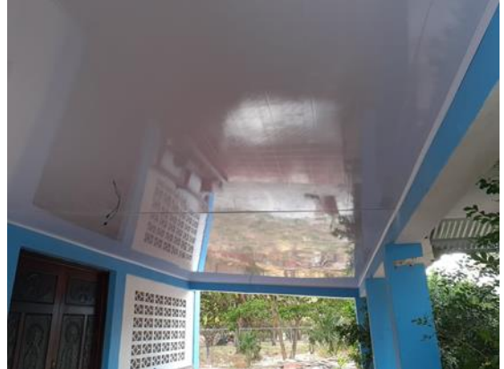
Paradas de buses en las comunidades de Santa Elena y Bella Vista del Distrito de Santa Cecilia